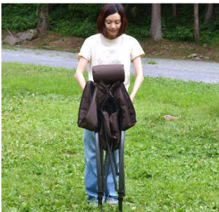
チェアを収納バッグから出し、○部のフックを外します。

揺らすことの出来るロッキングチェアは、破損の不安が有ると思いますが、丈夫なスチールフレームなので安心してご使用いただけます。ブラックとブラウンのシンプルなカラーなので、キャンプ以外にもレジャーや家の庭、バルコニーでのご使用もおススメなアイテムです。