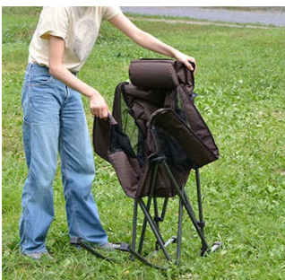
アームレストとヘッドレストをそれぞれ対角に手で広げます。