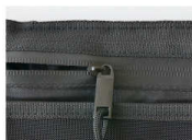
雨の侵入を防ぐ止水ジップ 雨の侵入を防ぐ止水ジップを採用。急な雨の時にも安心です。