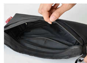
内側のポケット サコッシュ内の内側には、濡れることが特に心配な時に便利なポケット付き。