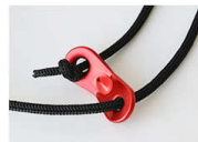
アルミ製の自在 ショルダラーの長さ調節はアルミ製の自在を採用。赤色がアクセントになります。