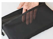
メッシュポケット フロントに「すぐに取り出したい」物を入れるのに便利なメッシュポケット。