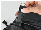
バックル付きキーチェーン 内側にはバックル付きのキーチェーン付き。鍵を入れる時に安心です。