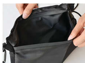
背面側のポケット サコッシュのメインポケット同様のサイズのポケットが背面に。