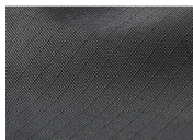
リップストップ生地使用 サコッシュの生地には、万が一裂けても進行を防ぐリップストップ生地を使用。

必要最低限の物を収納できる便利なサコッシュをFIELDORのこだわり満載で作りました。どんな服装にも合わせやすいようにブラックカラー単色とし、赤タグでアクセントを付けています。また、複数のポケット・キーチェーンなど機能性をプラス。更にアウトドアでの使用を考え、リップストップ生地には止水ジップを採用。止水ジップは、ジッパー部分からの水の侵入を抑えてくれます。デザイン、機能性にこだわったFIELDORのサコッシュをアウトドア、タウンユースに上手く取り入れてみてはいかがでしょうか。