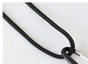
アウトドア感あるガイロープ 肩がけ用の紐として、太さ3mmのガイロープを採用。アウトドア感あふれるデザイン。