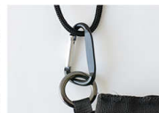
取り外ししやすいカラビナ カラビナを採用しているので、ロープを簡単に取り外すことができます。