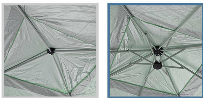
通常の屋根柱は4本 ⇒ 強化版の屋根柱は8本に進化

FIELDORにて不動の人気を誇るタープテントシリーズに強化版(スチール)が3.0m/2.5mの2サイズで追加されます。強化版の違いは、通常版は屋根柱4本に対して、強化版は倍の8本に進化。サイドのフレームが固定される事で、強度が格段にUPしました。タープテント設置で最も気になる風による破損の心配を軽減し、安心してご使用いただける様に設計いたしました。また、収納時のサイズは通常版のタープテントと同じなので、今まで同様、付属の収納袋に入れてコンパクトに持ち運びが出来ます。設置方法に関しても通常版のタープテントと同じで、組み立ての必要なく、大人2人で持ち上げてゆっくり広げるだけで簡単に設置が可能です。重さに関しては、通常版は3.0m:(約)14kg / 2.5m:(約)12kgなのに対し、強化版は3.0m:(約)16kg / 2.5m:(約)13.5kgと可能な限り重さを抑えての強化パーツ追加としています。